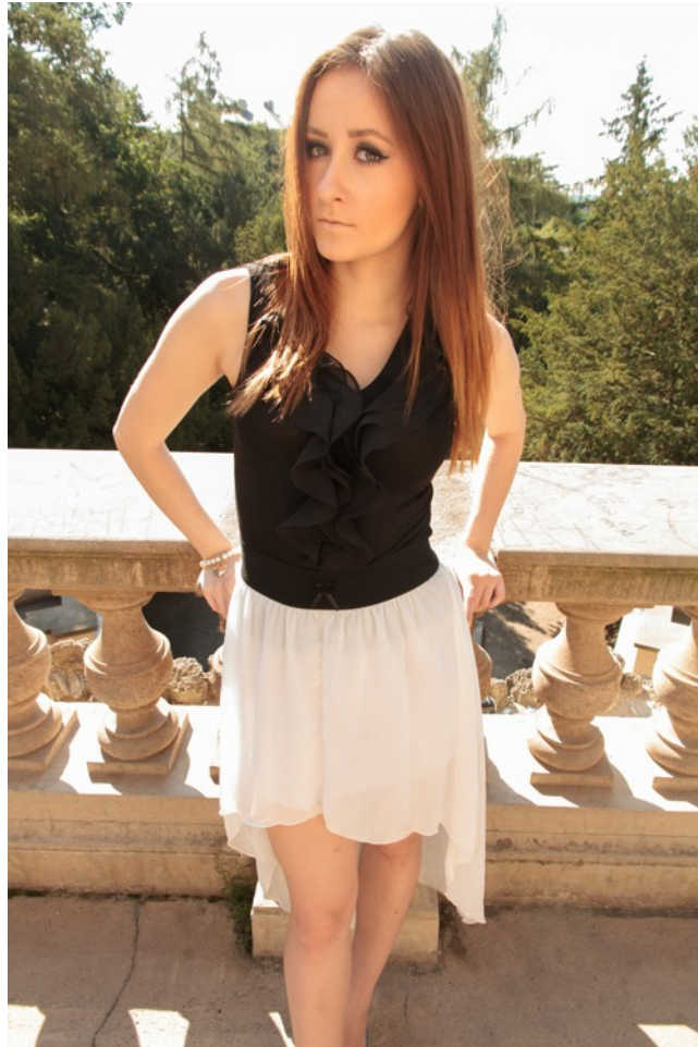
Zkušební neupravený portrét pro ukázkou nevhodně zvolené perspektivy. Použitím objektivu s příliš krátkou ohniskovou vzdáleností (širokoúhlý objektiv) došlo k deformaci postavy. Deformace je navíc zvýrazněna snímáním z úrovně očí.

Při fotografování s objektivem s menší ohniskovou vzdáleností musíme pro vyplnění obrazového pole přistoupit blíže, neboť pokud bychom fotili z přirozené pozorovací vzdálenosti, portrétovaný by byl na fotografii příliš malý a ztrácel by se v ní. To, že změním stanovisko má ovšem za následek změnu perspektivy. Objekty