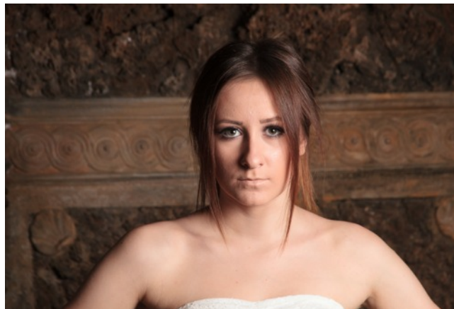
Zkušební neupravený portrét pro ukázkou směrového měkkého nasvícení, které modelku krásně vymodeluje. K nasvícení byl použit systémový blesk opatřený difúzním deštníkem umístěný napravo od fotoaparátu.

Lokální světlé a tmavé fleky budou odstraněny při následné retuši.