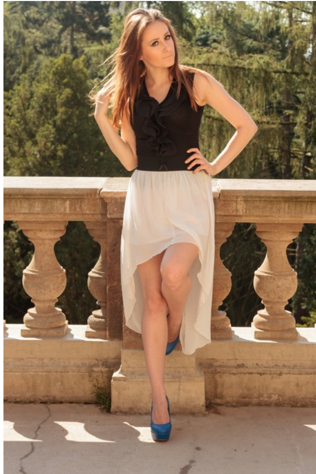
Zkušební neupravený portrét pro ukázkou správně zvolené perspektivy. Byl použit objektiv s ohniskovou vzdáleností 80 mm, který umožnil fotografovat z dostatečného odstupu.

Kompozice určuje, jakým způsobem jsou jednotlivé prvky ve fotografii (tradičně přední, prostřední a zadní plán) umístěny jak vůči okrajům fotografie, tak vůči sobě navzájem. Kompozice je dána pozicí fotografa vůči fotografované scéně. Volbou stanoviště fotograf určuje, kde se