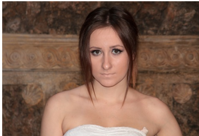
Zkušební neupravený portrét pro ukázkou plochého nasvícení. K nasvícení byl použit interní blesk fotoaparátu. Obličej není vymodelován, pod bradou vidíme ostrý stín.

I naprostý laik dokáže díky automatickým expozičním funkcím ve fotoaparátu pořídit správně exponovaný snímek. Složitější je to ovšem s realizací tvůrčího záměru. Světlo máme pod kontrolou pouze omezeně, a pokud ho chceme dokonale zvládnout, obvykle se neobejdeme bez asistentů, kteří nám pomáhají světlo usměrňovat pomocí odrazných desek a dalších pomůcek. Pokud nedisponujeme dostatečně velkým štábem asistentů, nezbývá než se světlu na scéně přizpůsobit. Tzn. je potřeba najít takové místo, kde je světlo ideální pro umístění portrétovaného, přičemž musíme věnovat pozornost okolí a zejména pak pozadí za portrétovaným. Také expoziční hodnoty musíme přizpůsobit světlu na scéně a mnohdy tak nemůžeme důsledně dodržet původní tvůrčí záměr. Např. když je světla příliš, tak si nemůžeme dovolit fotit s dostatečně